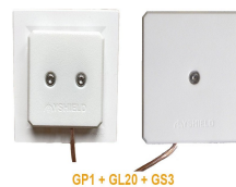
GP1 + GL20 + GS3