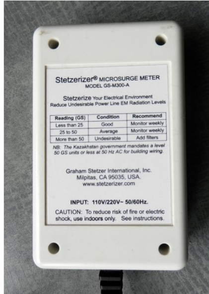
Comparatif Line EMI meter vs Micro-Surge Meter :